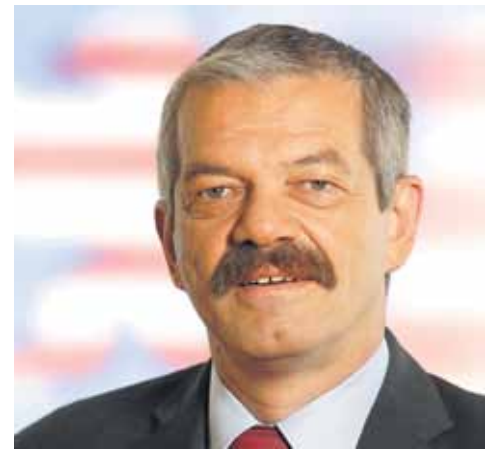
Günter Schork MdL , Fraktionsvorsitzender

Im Fokus unserer Politik für den Kreis Groß-Gerau stehen außerdem der Ausbau der medizinischen Grundversorgung und die Förderung der Hospiz- und Palliativversorgung, die Erweiterung der Kinderbetreuungsangebote, die Teilhabe von Menschen mit Behinderung am gesellschaftlichen Leben sowie die Intensivierung der Kriminalitätsbekämpfung und Stärkung der Polizei- und Sicherheitskräfte.