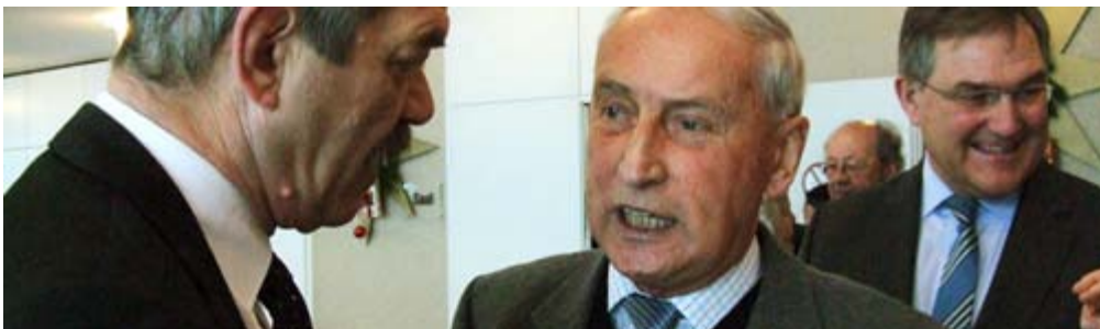
Günter Schork im Gespräch mit Bürgern aus seinem Wahlkreis